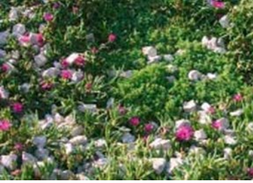
Detaylı bitki kompozisyonu