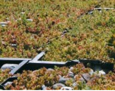
Şaşırtmalı bini görüntüsü