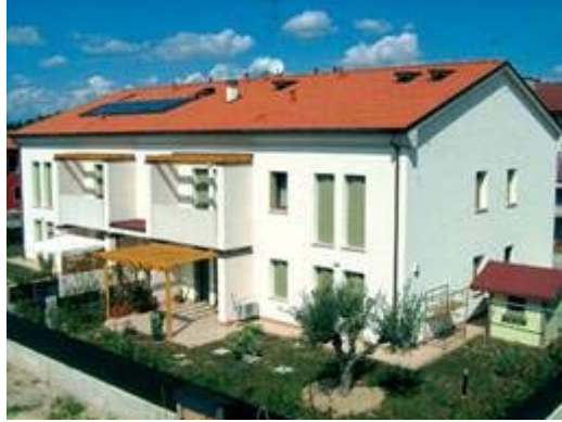
Şek.1 Konutun 3D modellemesi

Konut olarak tasarlanan binanın optimal sağlık yaşam koşulları sunabilmesi için havalandırmalı tek parça bir temel tercih edilmiştir. Modulo, döşeme ve temel kirişlerinin tek seferde dökülmesini mümkün kılarak binanın yapısal dayanımına katkıda bulunur. 4.320 m 2 'lik alan Modulo H20 ile döşenmiştir.