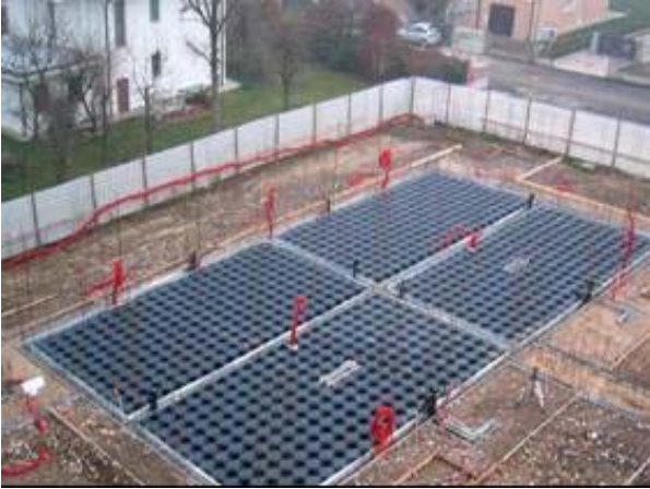
Şek.2 Beton dökümüne hazır temel kalıbı

Konut olarak tasarlanan binanın optimal sağlık yaşam koşulları sunabilmesi için havalandırmalı tek parça bir temel tercih edilmiştir. Modulo, döşeme ve temel kirişlerinin tek seferde dökülmesini mümkün kılarak binanın yapısal dayanımına katkıda bulunur. 4.320 m 2 'lik alan Modulo H20 ile döşenmiştir.