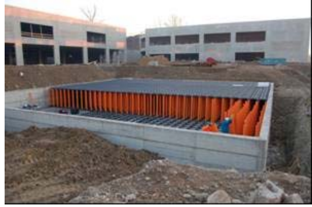
Şek.3 YENİ ELEVETOR TANK kalıp sisteminin elle montajı, yükseklik 2 m.

Projede, oldukça küçük bir yüzey alanında büyük miktarda sel suyunun depolanması gerektiğinden Yeni Elevetor Tank seçilmiştir. Sistemin 2 m'lik derinliği sayesinde sadece 506 m 2 'de 1000 m 3 su depolanır. Toplanan suyun bir kısmı yangın musluklarına bağlanarak acil durumlarda kullanılabilir.