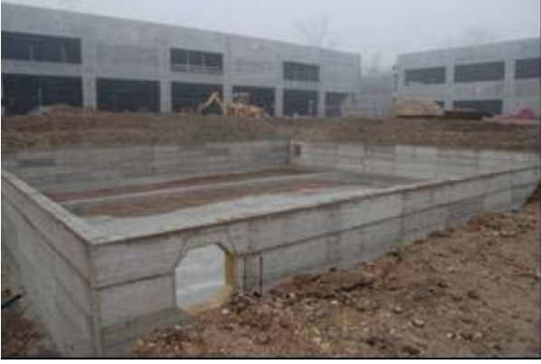
Şek.2 Giriş-çıkış boruları için delikler ile birlikte zemin plağı ve çevre duvarların inşası