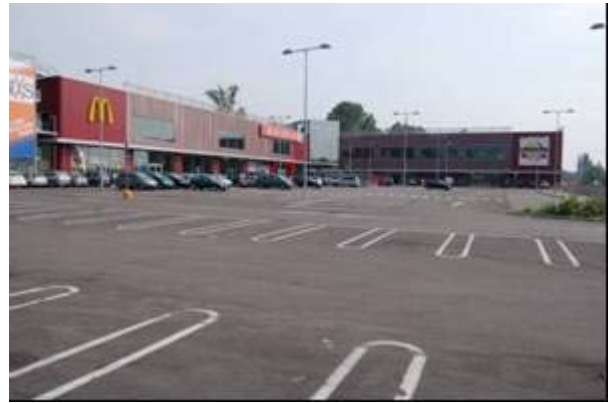
Şek.5 Bitmiş otopark