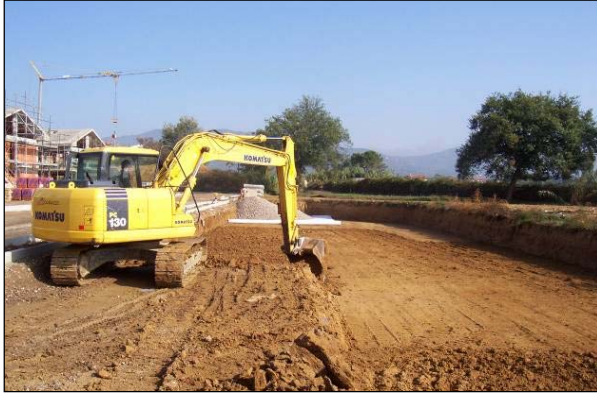
Şek.2 Hafriyat çalışması

Yerel su idaresi, çevre kanalın kullanımı için maksimum 10 l/s'lik bir deşarj kotası belirtmiştir. Proje geliştirme çalışmasında hesaplanan sel suyu yüzeysel akışı, bir deşarj azaltma sisteminin gerekliliğini ortaya koymuştur.