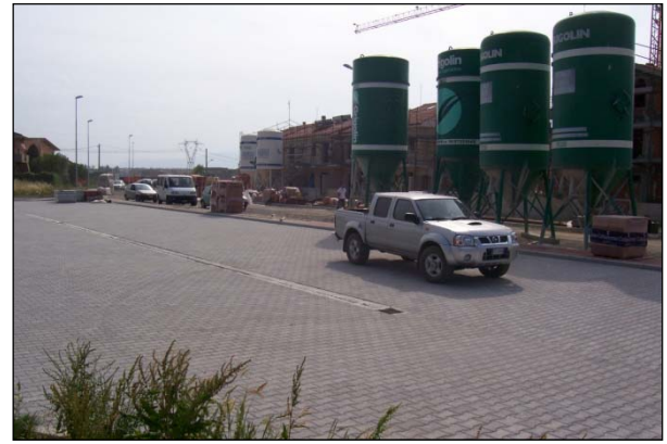
Şek.5 Bitmiş otopark