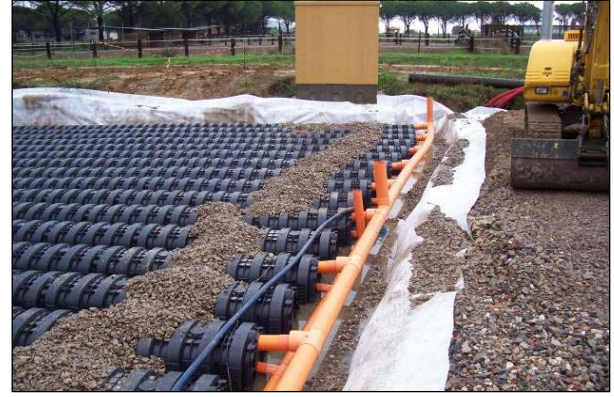
Şek.3 Giriş borularının detayı

Sel suyu bekletme havzası oluşturmak için Drening kullanılmış ve otoparkın inşasında sistemin yüksek yük taşıma kapasitesinden yararlanılmıştır.