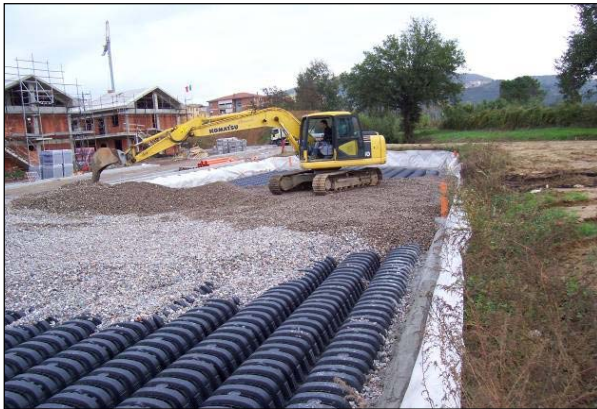
Şek.4 Geri dolgu

Sel suyu bekletme havzası oluşturmak için Drening kullanılmış ve otoparkın inşasında sistemin yüksek yük taşıma kapasitesinden yararlanılmıştır.