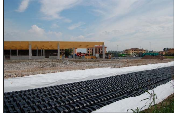
Şek.3 Geotekstil örtü

Drening, otoparkın şeklini taklit eden baklava biçimli bir alanda kurulmuştur (şek.2 ile şek. 4'e bakın). Böylece süpermarket binasının hemen yanında boşluklar oluşması önlenmiştir. İş sırasında kili içeride tutmak ve sisteme ince partiküllerin girişini önlemek için kazı çevresi geotekstil ile örtülmüştür.