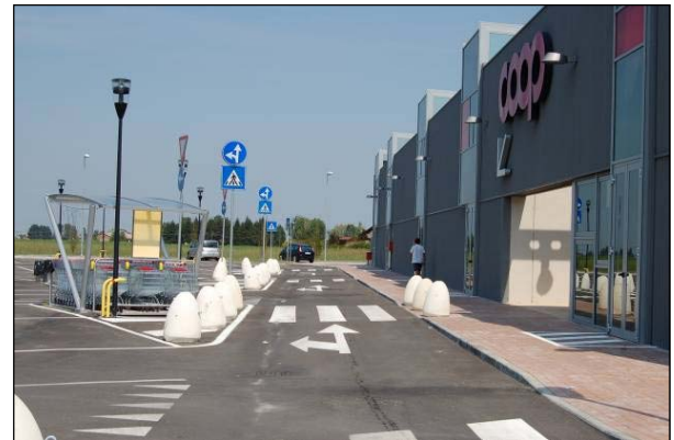
Şek.5 Bitmiş otopark