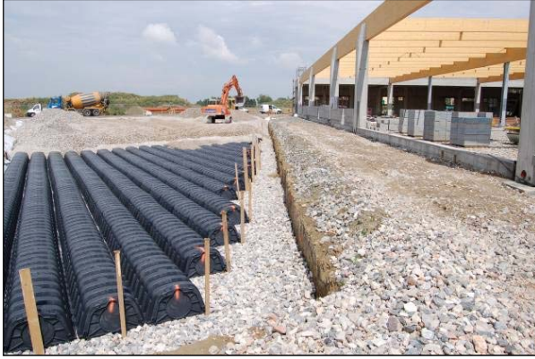
Şek.2 Baklava biçimli alanda Drening odalarının montajı