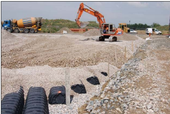
Şek.4 Geri dolgu

Drening, otoparkın şeklini taklit eden baklava biçimli bir alanda kurulmuştur (şek.2 ile şek. 4'e bakın). Böylece süpermarket binasının hemen yanında boşluklar oluşması önlenmiştir. İş sırasında kili içeride tutmak ve sisteme ince partiküllerin girişini önlemek için kazı çevresi geotekstil ile örtülmüştür.