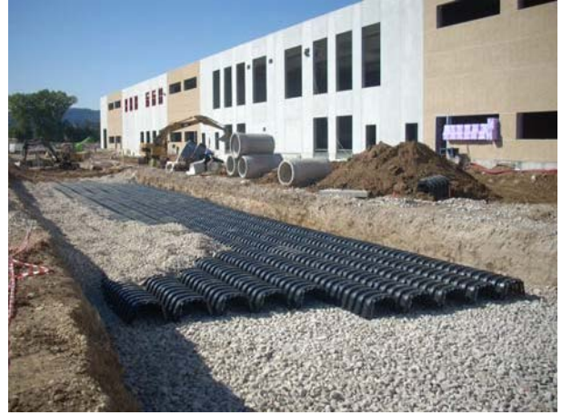
Şek.3 Çakıl serilmesi

Ağır araçların park edebileceği otopark alanlarında yayılı su havzaları oluşturabilmek için ideal bir sistem olduğundan Drening ürünü tercih edilmiştir.