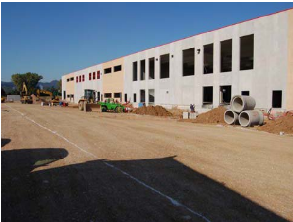
Şek.4 Lojistik binasının dışarıdan görünümü

Ağır araçların park edebileceği otopark alanlarında yayılı su havzaları oluşturabilmek için ideal bir sistem olduğundan Drening ürünü tercih edilmiştir.