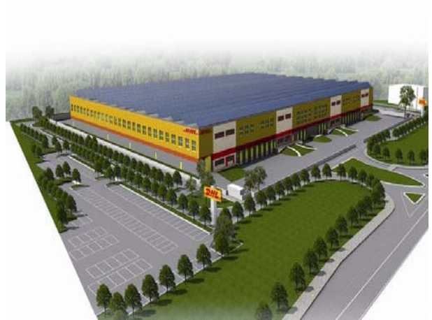
Şek.5 Proje modeli