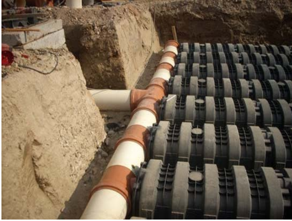
Şek.2 Drening H40 modüllerinin kurulumu